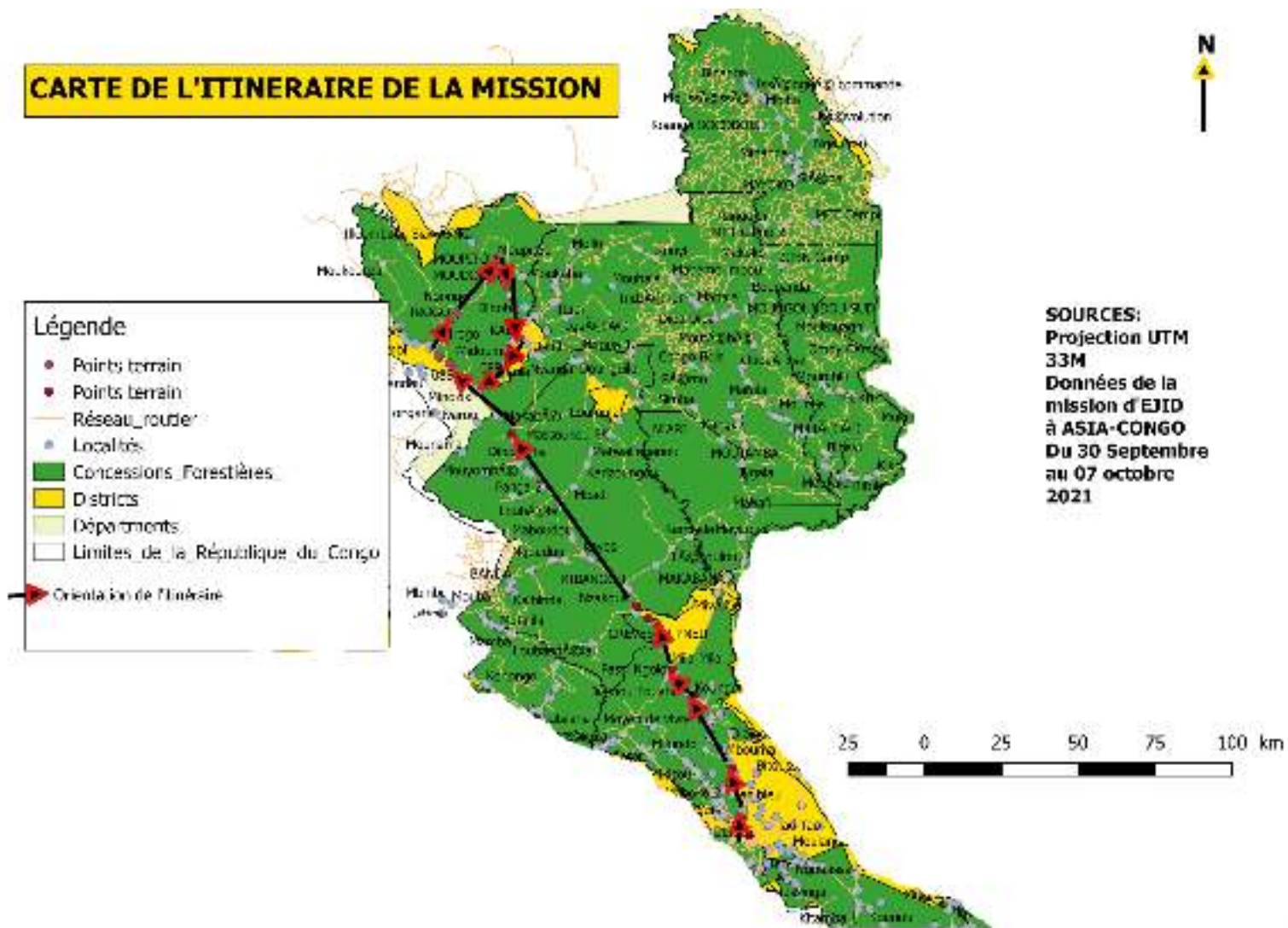
Carte de localisation de la zone de mission (figure 1) :