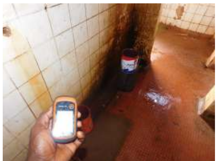
Photos 3 & 4 : Toilettes et douche non entretenues à l'usine (30 Septembre 2021) ;