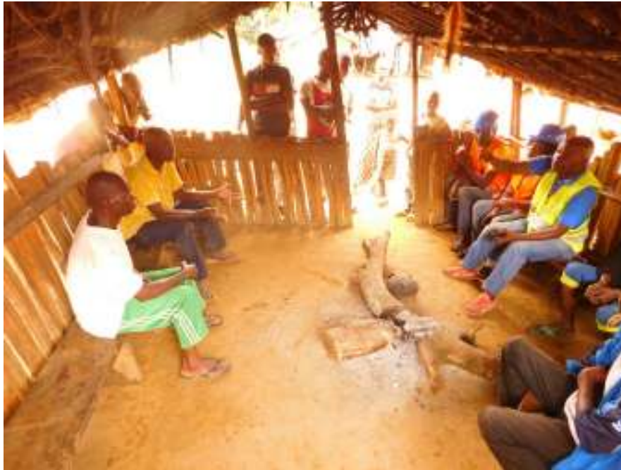
Photo 5 : Entretien entre l'équipe de mission et les communautés de Moupitou autour de leur chef du village et son secrétaire (04 octobre 2021)

(GPS 33M ; UTM : X 0242340 ; Y 9534639GPS 33M & UTM : X 0242340 ; Y 9534639)