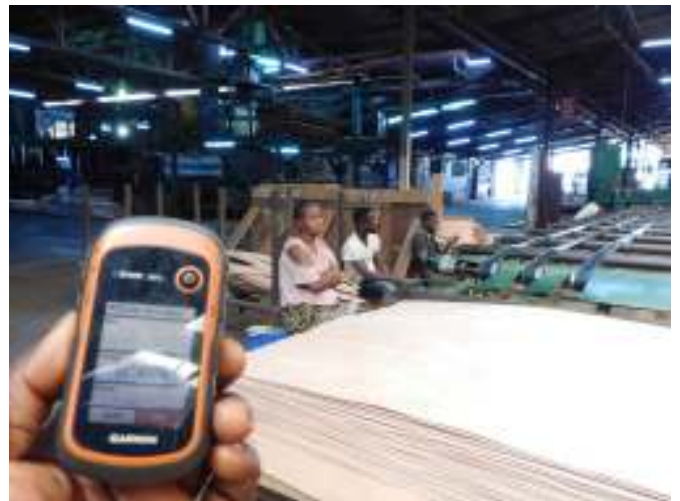
Photos 1 & 2 : personnel dans l'usine sans équipement de protection individuelle (30 septembre 2021)